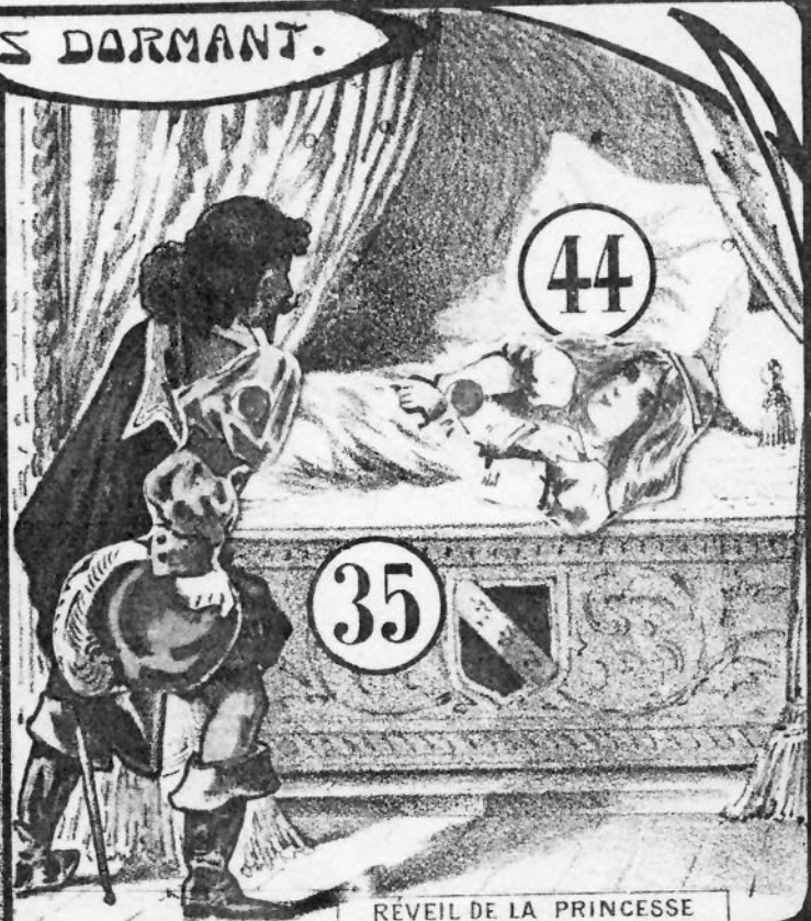
RÉVEIL DE LA PRINCESSE