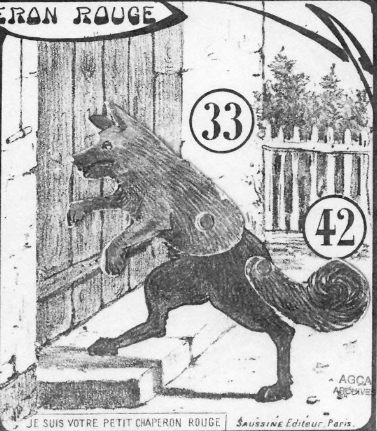
JE SUIS VOTRE PETIT CHAPERON ROUGE