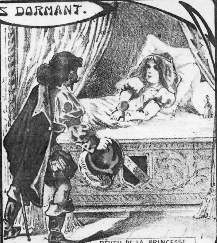
RÉVEIL DE LA PRINCESSE