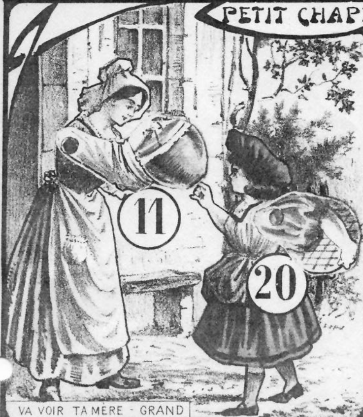
VA VOIR TA MÈRE - GRAND