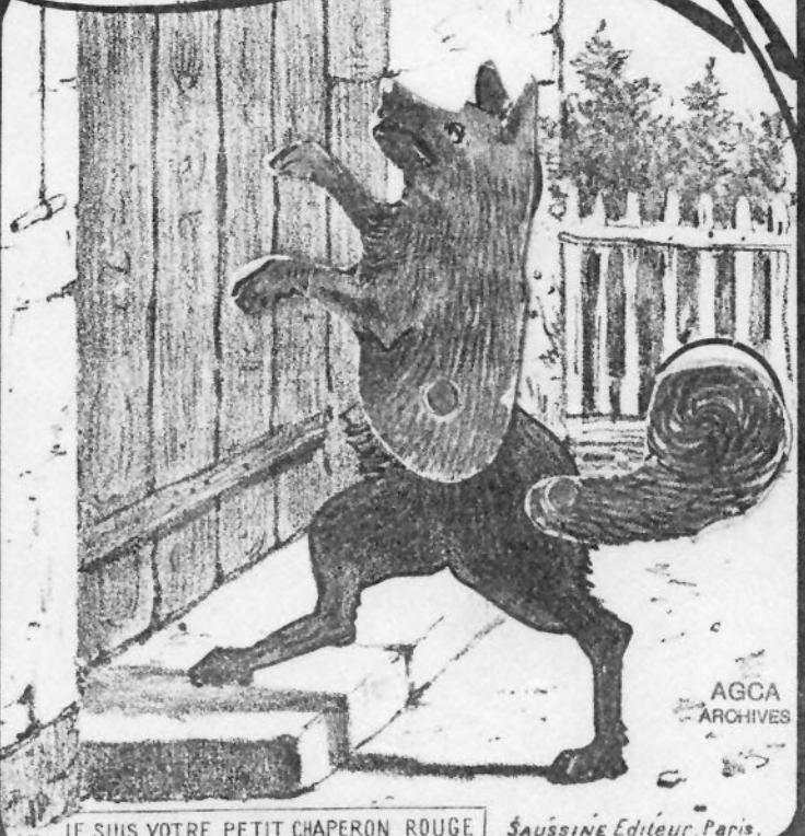
JE SUIS VOTRE PETIT CHAPERON ROUGE