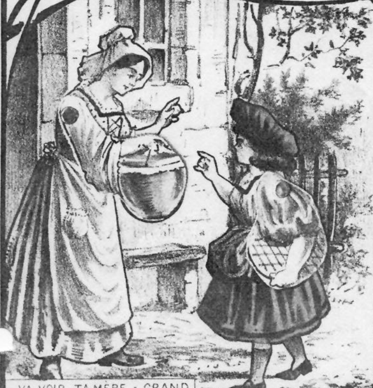
VA VOIR TA MÈRE - GRAND